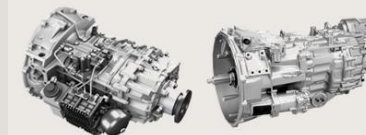
ZF-AS Tronic lite